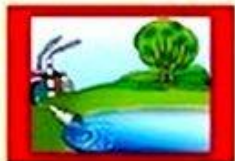
МЕСТА СБРОСА СТОЧНЫХ ВОД