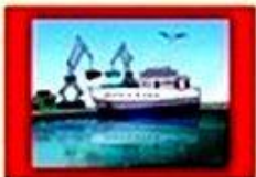
МЕСТА ВБЛИЗИ ПОРТОВЫХ СООРУЖЕНИЙ