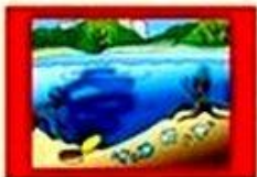
НЕЗНАКОМЫЕ МЕСТА, ГДЕ МОГУТ БЫТЬ ВОДОВОРОТЫ, ЗАТОНУВШИЕ ДЕРЕВЬЯ, МЕТАЛЛОЛОМ И РАЗЛИЧНЫЙ МУСОР